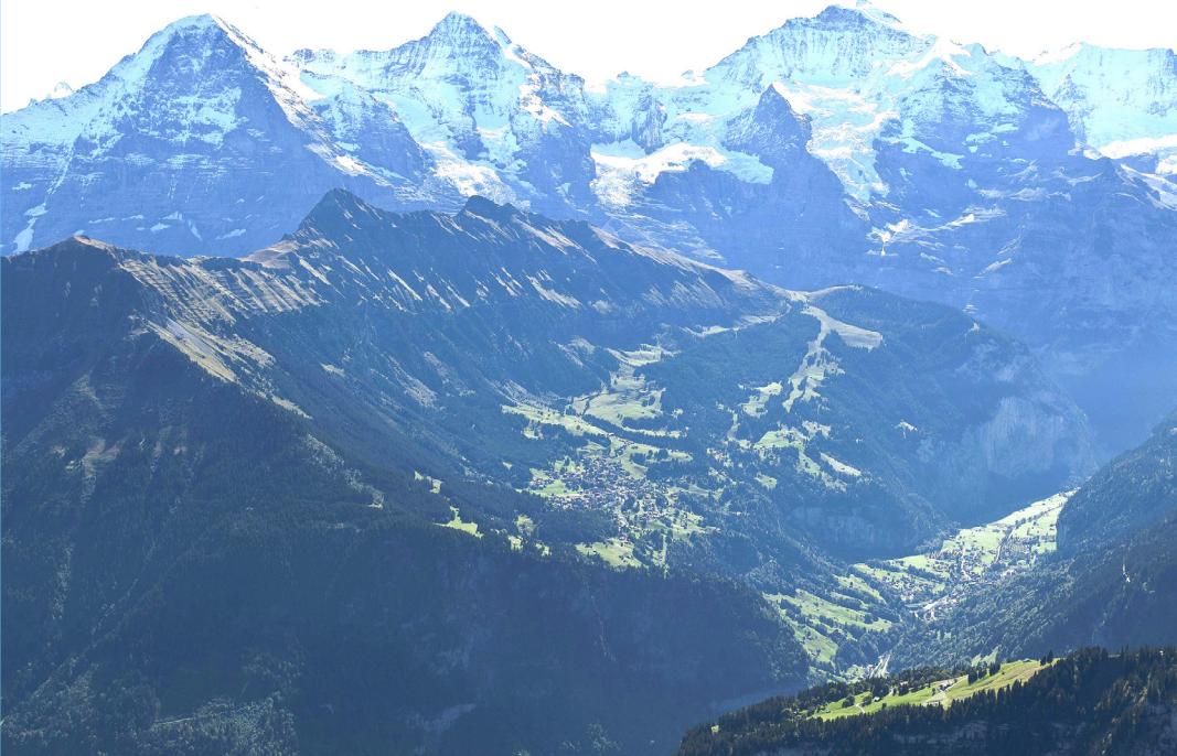
Abb. 1: Blick auf Wengen und Lauterbrunnen. Im Hintergrund Berner Hochalpen mit Eiger, Mönch und Jungfrau.